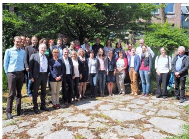
Nach der Gründungsveranstaltung in Göttingen

Der BAG LAG e.V. hat sich zum Ziel gesetzt, die Interessen aller LEADER-Regionen in den Bundesländern zu bündeln und auf nationaler und europäischer Ebene einzubringen. Dabei steht die Stärkung des Bottom-up-Ansatz als besonderem Merkmal von LEADER im Fokus. In einer regionalen Strategie werden Impulse und Ideen aus der Bevölkerung gebündelt und mit der Unterstützung von Fördermitteln der Europäischen Union im Sinne einer nachhaltigen Regionalentwicklung umgesetzt. Ein wichtiges Ziel der Bundesarbeitsgemeinschaft ist es, sich für Förderbedingungen einzusetzen, die an die ehrenamtlichen Strukturen der vielfältigen regionalen Akteure angepasst sind. Zudem stellt die BAG LAG ein Netzwerk dar, in dem die Regionalmanager und Regionalmanagerinnen der einzelnen Regionen ihre Erfahrungen austauschen, unterstützen und kooperieren können.